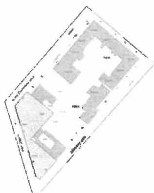
Az ingatlanok elhelyezkedése az 1. Kerületben

A telkeken tehát bruttó 7700 m 2 felépítmény + 2000 m 2 pince építhető (ebből a hasznos alapterület 7400 m 2 ). 2023-as árszinten önköltségben 1 m 2 átlagos szerkezetű, megjelenésű és funkciójú épület megépítése kb. nettó 1.200.000,- Ft-ba kerül, vagyis a teljes projektköltség 1.200 eFt x 9700 m 2 = 11.640.000,- eFt, azaz nettó 11,64 milliárd forint összegre tehető, ez 27 %-os ÁFÁ-val növelten bruttó 14,78 milliárd Ft, kerekítve 15 milliárd Ft projektárat jelent, amennyiben a telkek beépítési lehetőségét teljes mértékben kihasználjuk. Ez esetben akár 90 db önkormányzati tulajdonú, korszerű lakás jön létre és 1000 m 2 sokcélúan felhasználható közösségi tér a földszinten. Kisebb épülettel természetesen a költség is arányosan csökken. A projekt időbeli lefutása a finanszírozás tisztázását követően két éves előkészítő munkát jelent, ennek elemeit a továbbiakban részletezzük, a kivitelezés pedig három évet igényel, vagyis a projekt teljes megvalósulásának időtartama hozzávetőlegesen öt év. A projekt előzetes költségbecslése alapján a megvalósítás feltétele az önkormányzat saját pénzügyi forrásainak kiegészítése. A projekt - több szakaszra való bontásával - már a rendelkezésre álló saját források bevonásával is elindítható, illetve gyorsítható a beruházás.