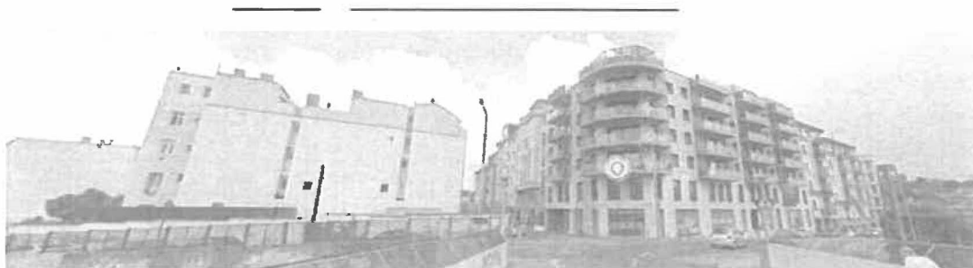
A Márvány hídról jól láthatóak az önkormányzati üres telkek balról, jobb oldalt pedig a Márvány u. 20. sz. alatt nemrég megépült lakóház

Az Önkormányzat tulajdonában álló, egymással szomszédos 3 db építési telek rendkívül értékes vagyontárgy, környezetükben a közelmúltban sikeres lakásépítési projekt futott le (Márvány u. 20.). Az ingatlanok komoly fejlesztési potenciáljuk következtében vonzóak lehetnek magán építőipari cégek vagy ingatlanfejlesztők számára. A közelmúltban megvásárolt Győző u. 11. számú ingatlan ebben a projektben értékesebb a vételáránál, mivel a kellemetlen háromszög alakú, önmagában nehezen beépíthető ingatlan a két szomszédos telekkel már jól beépíthetőbbé, így értékesebbé is vált.