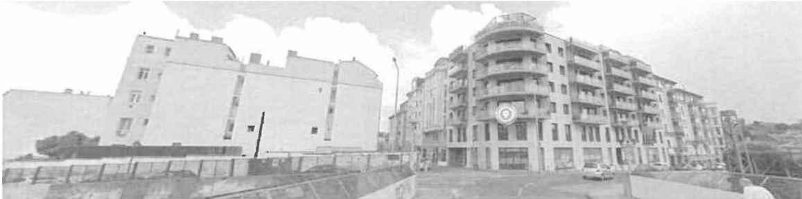
A Márvány hídról jól láthatóak az önkormányzati üres telkek balról, jobb oldalt pedig a Márvány u. 20. sz. alatt nemrég megépült lakóház

Az Önkormányzat tulajdonában álló, egymással szomszédos 3 db építési telek rendkívül értékes vagyontárgy, környezetükben a közelmúltban sikeres lakásépítési projekt futott le (Márvány u. 20.). Az ingatlanok komoly fejlesztési potenciáljuk következtében vonzóak lehetnek magán építőipari cégek vagy ingatlanfejlesztők számára. A közelmúltban megvásárolt Győző u. 11. számú ingatlan ebben a projektben értékesebb a vételáránál, mivel a kellemetlen háromszög alakú, önmagában nehezen beépíthető ingatlan a két szomszédos telekkel már jól beépíthetőbbé, így értékesebbé is vált.