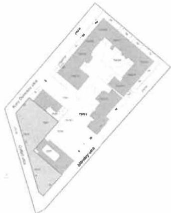
Az ingatlanok elhelyezkedése az 1. Kerületben

A telkeken tehát bruttó 7700 m 2 felépítmény + 2000 m 2 pince építhető (ebből a hasznos alapterület 7400 m 2 ). 2023-as árszinten önköltségben 1 m 2 átlagos szerkezetű, megjelenésű és funkciójú épület megépítése kb. nettó 1.200.000,- Ft-ba kerül, vagyis a teljes projektköltség 1.200 eFt x 9700 m 2 = 11.640.000,- eFt, azaz nettó 11,64 milliárd forint összegre tehető, ez 27 %-os ÁFA-val növelten bruttó 14,78 milliárd Ft, kerekítve 15 milliárd Ft projektárat jelent, amennyiben a telkek beépítési lehetőségét teljes mértékben kihasználjuk. Ez esetben akár 90 db önkormányzati tulajdonú, korszerű lakás jön létre és 1000 m 2 sokcélúan felhasználható közösségi tér a földszinten. Kisebb épülettel természetesen a költség is arányosan csökken. A projekt időbeli lefutása a finanszírozás tisztázását követően két éves előkészítő munkát jelent, ennek elemeit a továbbiakban részletezzük, a kivitelezés pedig három évet igényel, vagyis a projekt teljes megvalósulásának időtartama hozzávetőlegesen öt év. A projekt előzetes költségbeclése alapján a megvalósítás feltétele az önkormányzat saját pénzügyi forrásainak kiegészítése. A projekt - több szakaszra való bontásával - már a rendelkezésre álló saját források bevonásával is elindítható, illetve gyorsítható a beruházás.