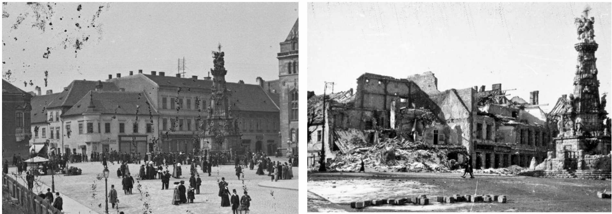
A Szentháromság tér sarka a háború előtt és után

(1959) épületei kezdtek, utolsó megvalósult eleme pedig a Jánossy György és Laczkovics László tervezte épület a Szentháromság tér 7. szám alatt, a volt diplomata lakóház, később Burg Hotel (1981).