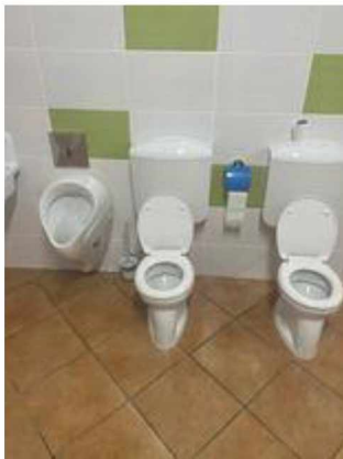
Iskola bölcsőde – fürösztő felújítás (2)