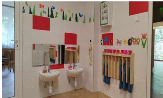
Iskola bölcsőde – fürösztő felújítás (2023)