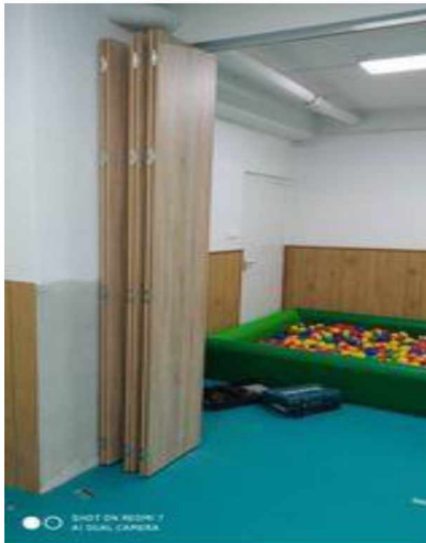
Iskola bölcsőde – új tornaszoba