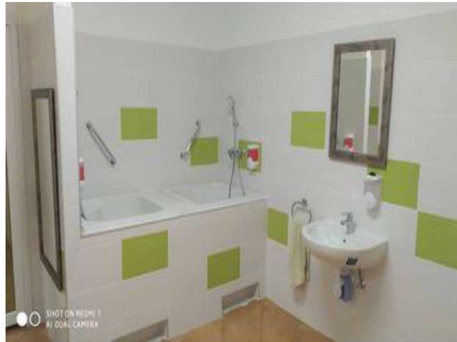
Iskola bölcsőde – fürösztő felújítás