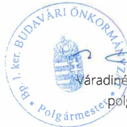
Váradiné Naszályi Márta polgármester